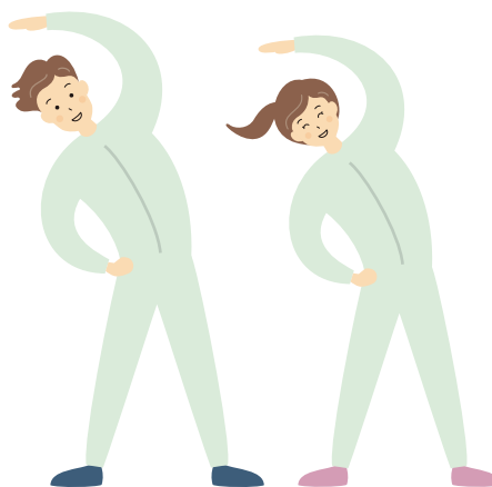
⑤毎日、健康活動の時間をもうけています

健康経営優良法人認定制度とは…特に優良な健康経営を実践している大企業や中小企業等の法人を「見える化」することで、従業員や求職者、関係企業や金融機関などから社会的な評価を受けることができる環境を整備することを目的に、日本健康会議が認定する顕彰制度です。 本制度では、大規模の企業等を対象とした「大規模法人部門」と、中小規模の企業等を対象とした「中小規模法人部門」の2つの部門を設けています。